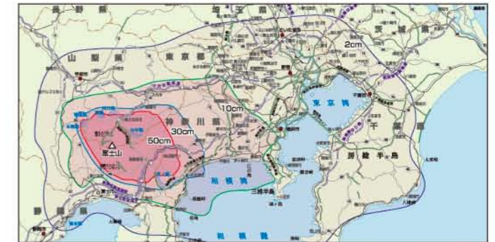
降灰の最大影響範囲