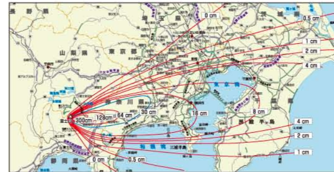
宝永噴火による影響範囲

噴火による降灰は、農作物への被害、人体への悪影響、交通機関の麻痺など、社会生活に深刻な影響を及ぼします。また、影響範囲も非常に広域で、長期間にわたって被害が続く事もあります。1707年(宝永4年)の宝永噴火の際は、偏西風の影響により、現在の富士宮市域にはほとんど降灰がありませんでしたが、偏西風の弱い季節に大規模な噴火がおきると、富士宮市にも降灰が発生する可能性があります。