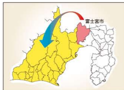
市外避難者の避難先

噴火の範囲が拡大し、市街地への影響が想定される場合、第4次A避難対象エリア、第4次B避難対象エリアも避難の対象となる可能性があります。その際、市内の避難先では収容が困難なため、右図のとおり県中部・西部地域への広域避難を行うこととなります。避難先、避難方法については、今後、県及び他市町と調整のうえ決定していく予定です。