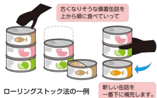
ローリングストック法の一例

日常生活で使用する食材やレトルト食品を、備蓄品の中から消費し、その都度買い足す事で備蓄品を新しい状態で保つ事をローリングストック法といいます。日常的に防災用品をチェックする事もできます。