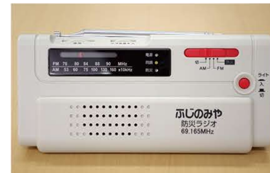
富士宮市防災ラジオ