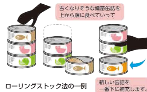
ローリングストック法の一例

日常生活で使用する食材やレトルト食品を、備蓄品の中から消費し、その都度買い足す事で備蓄品を新しい状態で保つ事をローリングストック法といいます。日常的に防災用品をチェックする事もできます。