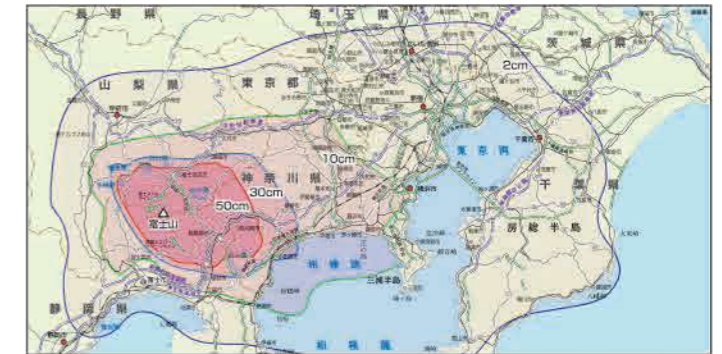
降灰の最大影響範囲