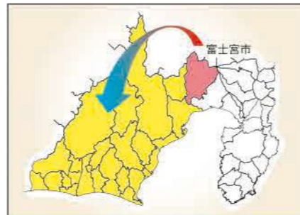
市外避難者の避難先

噴火の範囲が拡大し、市街地への影響が想定される場合、第4次A避難対象エリア、第4次B避難対象エリアも避難の対象となる可能性があります。その際、市内の避難先では収容が困難なため、右図のとおり県中部・西部地域への広域避難を行うこととなります。避難先、避難方法については、今後、県及び他市町と調整のうえ決定していく予定です。