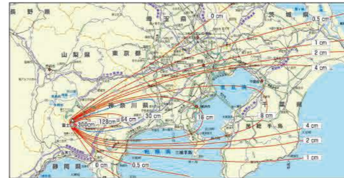
宝永噴火による影響範囲

噴火による降灰は、農作物への被害、人体への悪影響、交通機関の麻痺など、社会生活に深刻な影響を及ぼします。また、影響範囲も非常に広域で、長期間にわたって被害が続く事もあります。1707年(宝永4年)の宝永噴火の際は、偏西風の影響により、現在の富士宮市域にはほとんど降灰がありませんでしたが、偏西風の弱い季節に大規模な噴火がおきると、富士宮市にも降灰が発生する可能性があります。