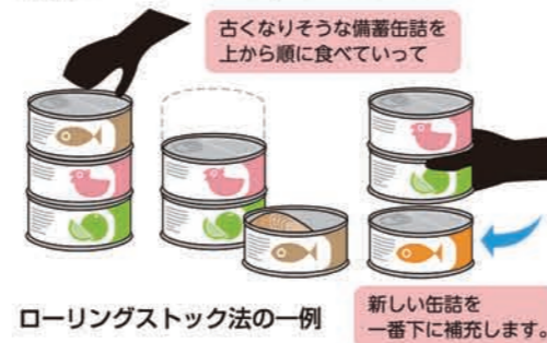
ローリングストック法の一例

日常生活で使用する食材やレトルト食品を、備蓄品の中から消費し、その都度買い足す事で備蓄品を新しい状態で保つ事をローリングストック法といいます。日常的に防災用品をチェックする事もできます。