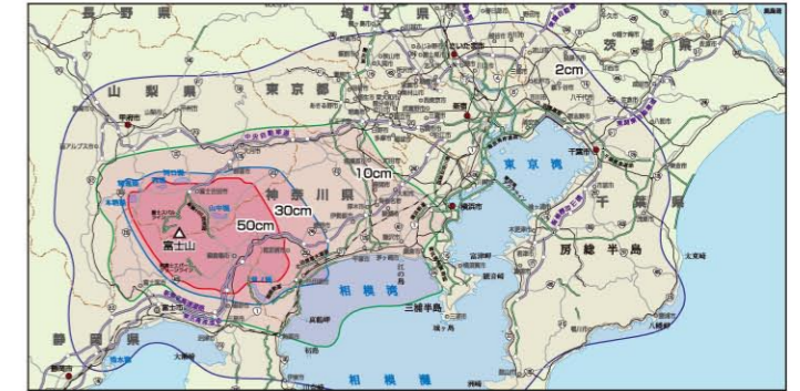
降灰の最大影響範囲