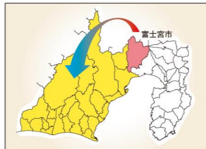
市外避難者の避難先

噴火の範囲が拡大し、市街地への影響が想定される場合、第4次A避難対象エリア、第4次B避難対象エリアも避難の対象となる可能性があります。その際、市内の避難先では収容が困難なため、右図のとおり県中部・西部地域への広域避難を行うこととなります。避難先、避難方法については、今後、県及び他市町と調整のうえ決定していく予定です。