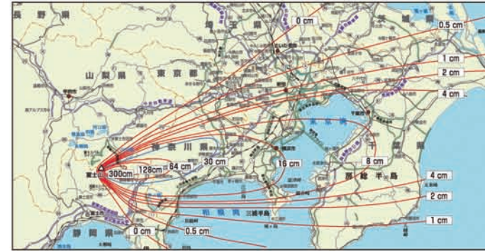
宝永噴火による影響範囲

噴火による降灰は、農作物への被害、人体への悪影響、交通機関の麻痺など、社会生活に深刻な影響を及ぼします。また、影響範囲も非常に広域で、長期間にわたって被害が続く事もあります。1707年（宝永4年）の宝永噴火の際は、偏西風の影響により、現在の富士宮市域にはほとんど降灰がありませんでしたが、偏西風の弱い季節に大規模な噴火がおきると、富士宮市にも降灰が発生する可能性があります。