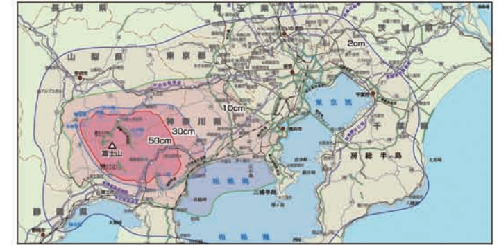
降灰の最大影響範囲